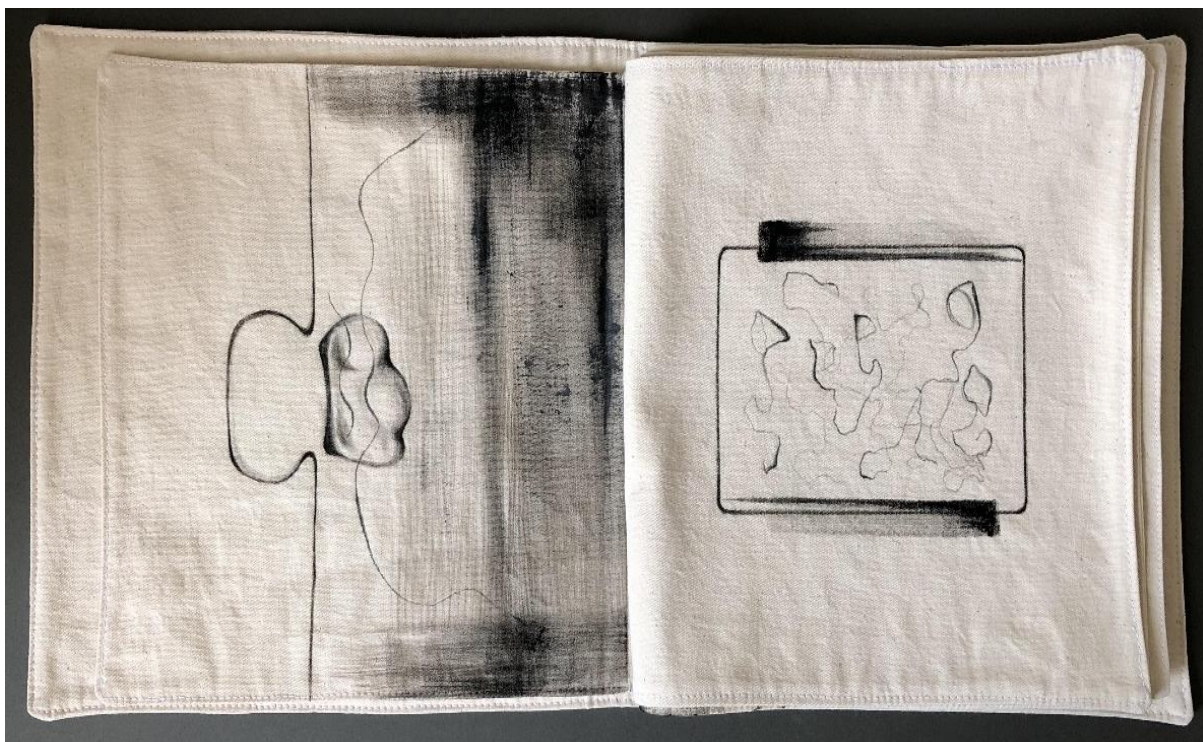
Samanta Petruša / Tin Ujević: Igračka vjetrova