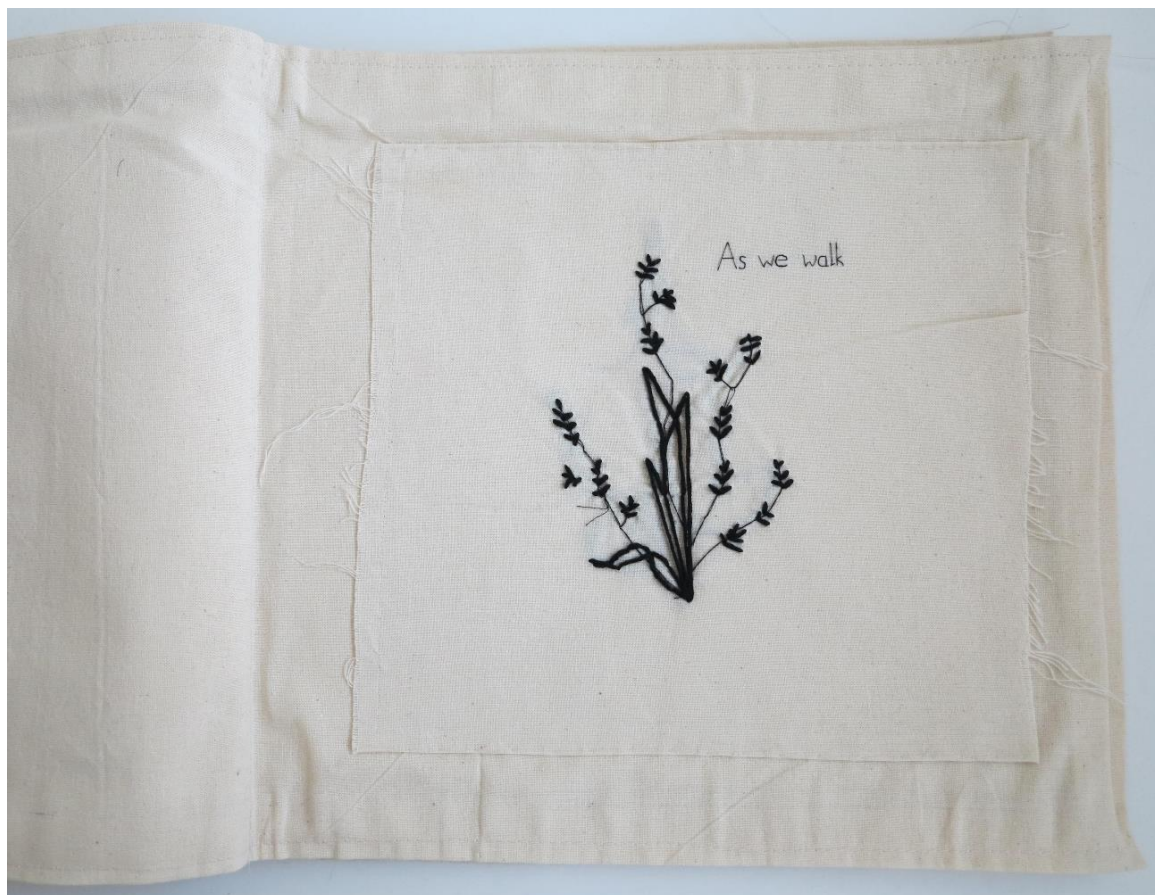
Dora Rakuljić / Sting: Fields of Gold