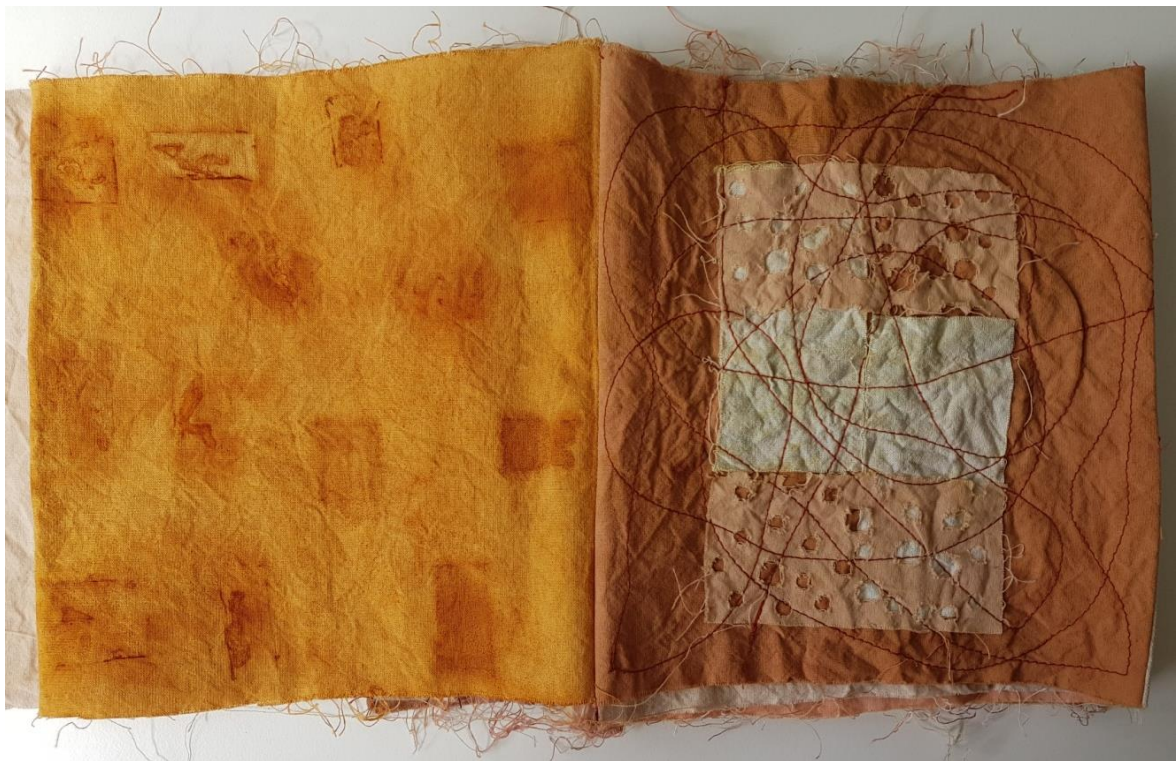
Viktorija Vuković / Matija Antun Relković: Satir iliti divlji čovik