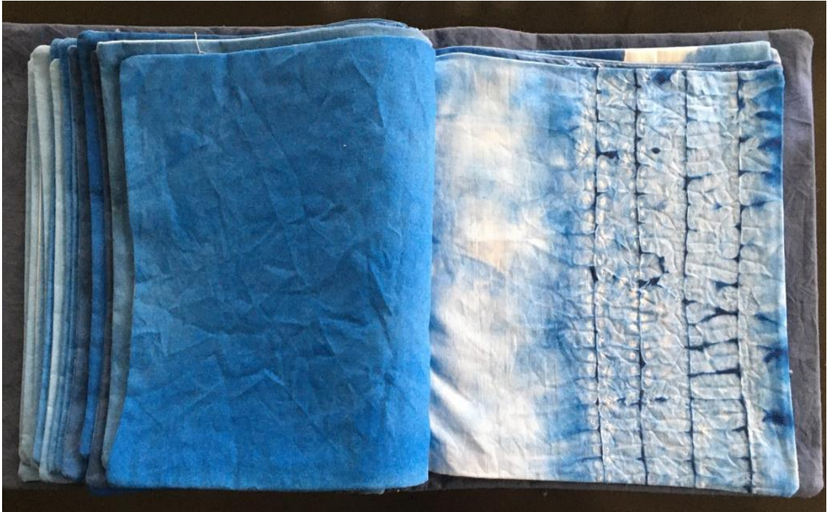
Leo Subanović / Jules Vern: 20000 milja pod morem