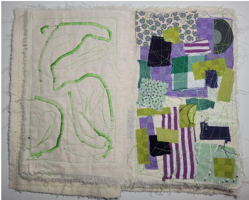
Laura Kalfić / Astrid Lindgren: Pipi Duga Čarapa